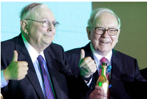
ชาร์ลีส มั่งเกอร์ (Charles Thomas Munger)

“หากทุกวัน เราทำให้ตัวเองฉลาดขึ้นกว่าตอนที่ตื่นสักเล็กน้อยท้ายที่สุด เราจะได้รับสิ่งดี ๆ ที่ควรได้จากชีวิต”